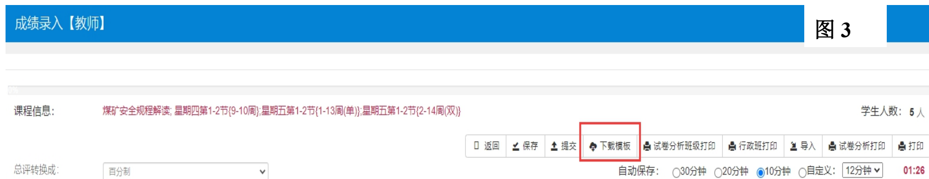
图 3 成绩录入“下载模板”界面