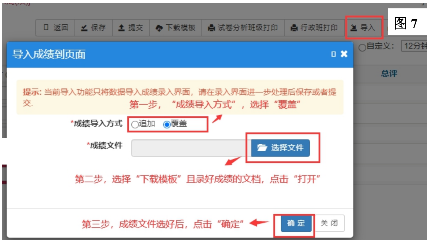
图 7 下载模板成绩导入