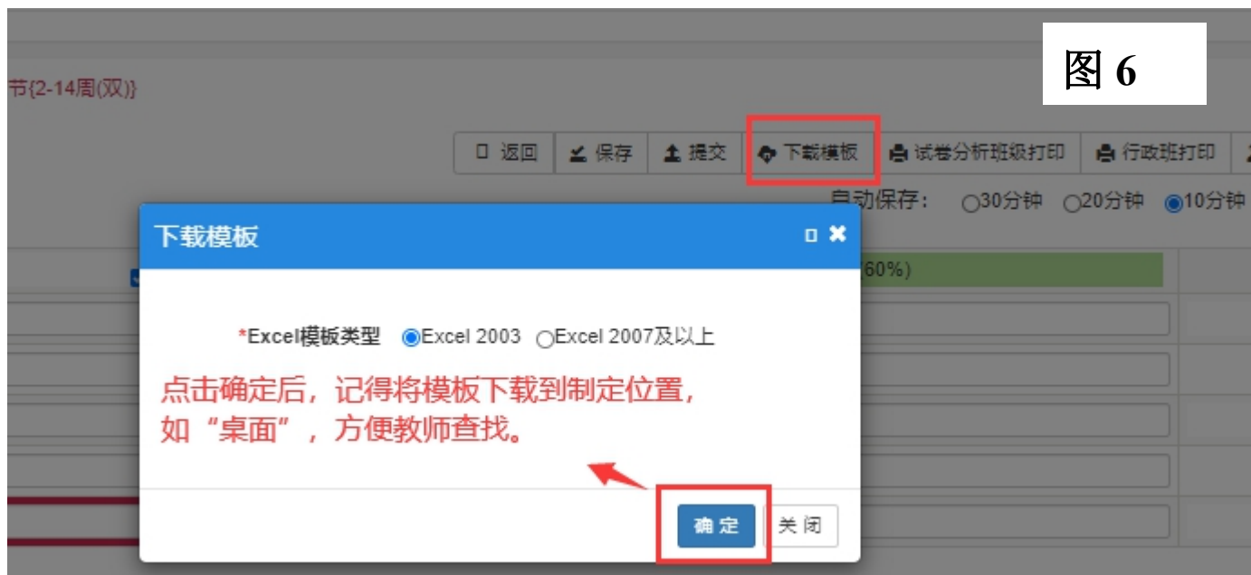
图 6 下载模板成绩录入