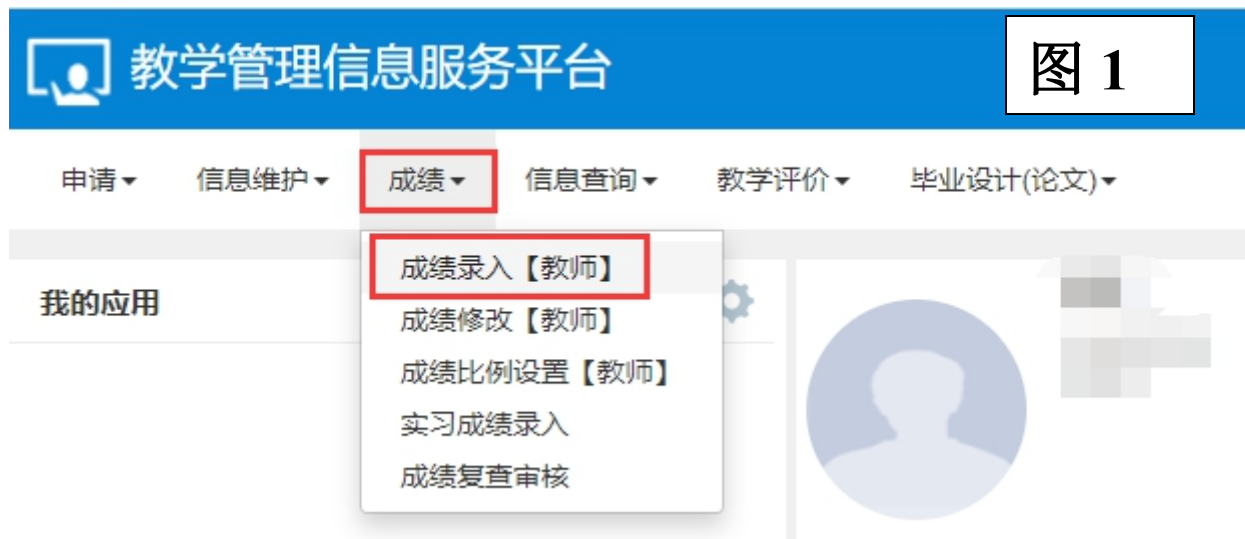
图 1 成绩录入界面